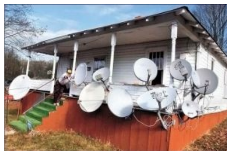
Селяне смотреть федеральные телеканалы в любом случае не хотят