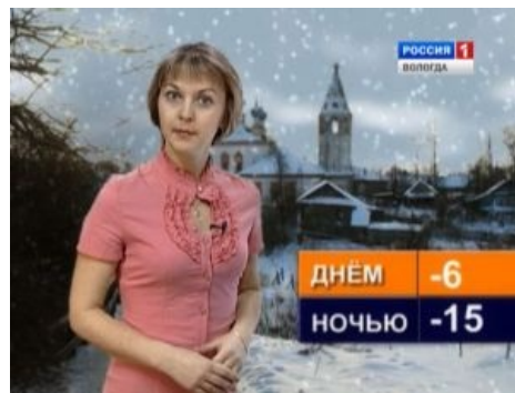
«По прогнозам вологодского гидрометцентра...»

Телеканал «Рифей-Пермь». В эфир, конечно, не пошло, но в интернет просочилось