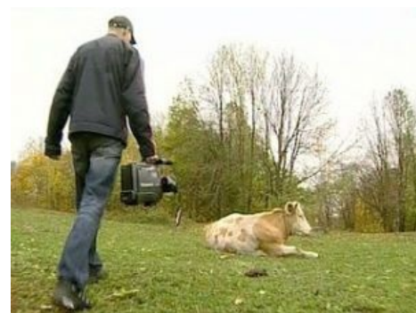
Оператор знает, как найти контакт с тёлочками

КВН Вне Игры - 12: сельское телевидение Убогое региональное ТВ глазами КВНщиков