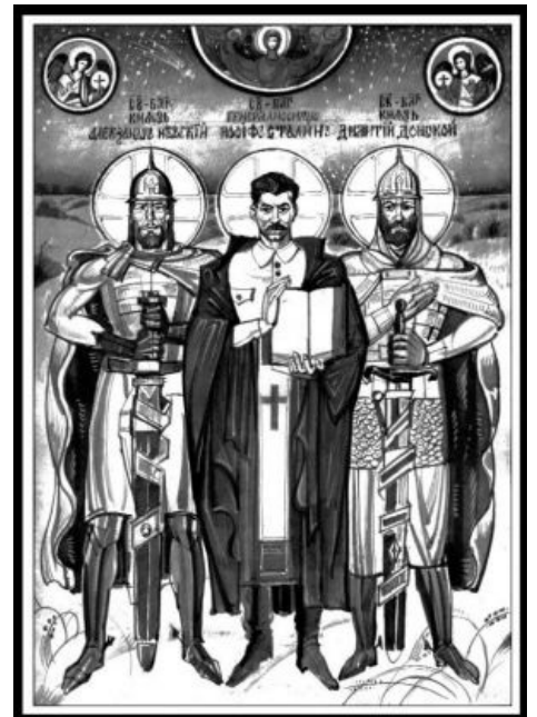
Ну и на десерт.