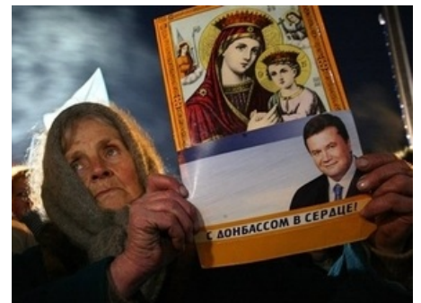
Ещё один пациент.

«Каждый народ имеет то правительство, которое заслуживает.»