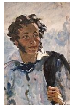
Неканонічний Пушкин работы Репина.

Эфиопы тоже люди, как бы странно это ни звучало. Александр Сергеевич, конечно, на мизерную часть мавр , но всё равно сказалось. На самом деле происхождение Абрама (Ибрагим, Авраам) Петровича Ганнибала, предка Пушкина, никто точно не знает. Ни могилы, ни портретов, ни мемуаров его не сохранилось. Известно о нем, лишь, что он был «арап», увезенный из Африки в турецкий плен. Арапами в старину для пушей политкорректности называли не только негров, но и эфиопов (которые представляют собой переходную расу между европеоидной и негроидной) и жителей Северной Африки .