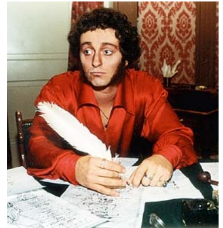
Некачественная копия Пушкина.

На самом деле, это положение дел легко объясняется тем, что Александр Сергеевич, будучи гениальным версификатором, собственного мнения ни по одному вопросу не имел либо тщательно скрывал его. А его стихи — гениально срифмованное изложение идей, услышанных в салонах и вычитанных в книгах. Через 140 лет в России появился ещё один похожий поэт, Владимир Семёнович Высоцкий , которого все, от зеков до интеллигенции и от алкоголиков до фронтвиков , считали своим.