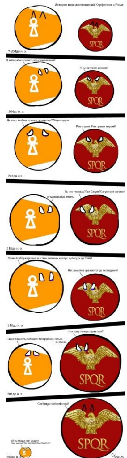
Краткое содержание статьи

Тем временем на Сардинии наёмники также восстали всё по той же причине. Они перебили карфагенян, но понимали, что вскоре их ждёт анальная кара. Рим, естественно, послал их лесом , ибо не комильфо. И