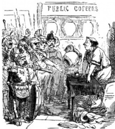
Ганнон Великий и наёмники, карикатура Джона Лича

После окончания войнушки толпы наёмников начали возвращаться в Карфаген, где немедленно задали вопрос главному: «Где деньги, Зин?». Но после проигранной войны и выплаты репараций с баблом была напряжёнка, к тому же правлящая клика без стыда разворовывала и без того скудные бюджетные фонды. Поэтому наёмникам кассир в Карфагене сказал, что кассу кто-то спиздил, но завтра новую привезут, надо только подождать немного. Дембелям на трудную финансовую ситуацию в стране было глубоко фиолетово , и, когда некто Ганнон Великий попробовал договориться с наёмниками об уменьшении размера причитающегося им жалованья, у них начался не просто когнитивный диссонанс , а лютый, бешеный батхёрт .