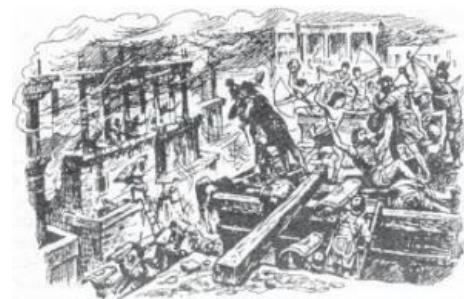
Уличные бои в Карфагене

стороны гавани и немедленно устроили народные гуляния , массово отправляя дружелюбно встречавших их мечами карфагенян напрямик в Ад . Стариков и женщин, как водится, пропускали без очереди. В результате сего действия все улицы превратились в выставку отборнейшего гуро . Но не только сопротивление карфагенян и завалы на улицах замедляли движение. Легионеры постоянно отвлекались на богато украшенные карфагенские храмы, чтобы захватить с собой какой-нибудь сувенир на память.