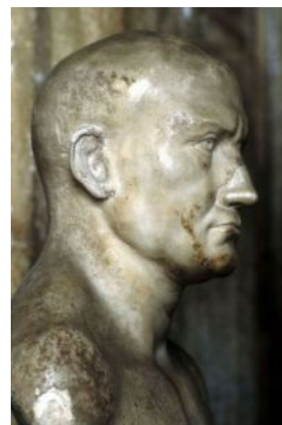
Сципион Эмилиан разрушил Карфаген. А чего добился ты?