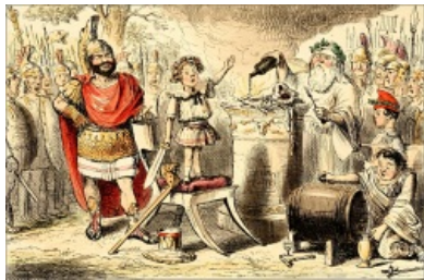
Клятва Ганнибала, карикатура Джона Лича

сына Ганнибала. Как гласит легенда, Ганнибал всегда испытывал ненависть к Риму, потому что перед походом, будучи ещё малолетним долбоёбом, произнес перед алтарем клятву всегда ненавидеть Рим и бороться с ним. И до конца своей жизни Ганнибал пытался обосрать малину римлянам.