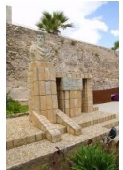
Памятник Гасдрубалу в Картахене