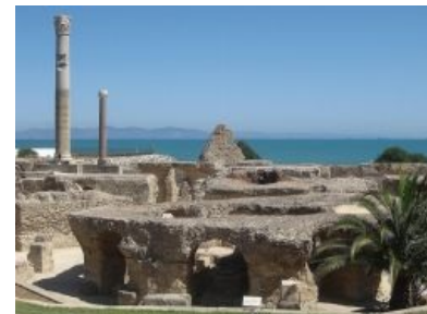
Руины римского Карфагена

Римляне постарались стереть любые упоминания о том, что когда-то существовала империя пунов, поэтому уничтожили не только сам город, но и предметы искусства, храмовые принадлежности, сожгли все книги, из которых уцелел лишь трактат знаменитого карфагенского эксперта в области сельского хозяйства Магона. Эти трактаты были настолько продвинутые, что их штудировали даже в Средневековье! Поскольку потомки Ромула тоже были выходцами из аграриев , они фапали на всё, связанное с сельским хозяйством. Иначе бы труды Магона также пошли бы на растопку в одной из римских терм.