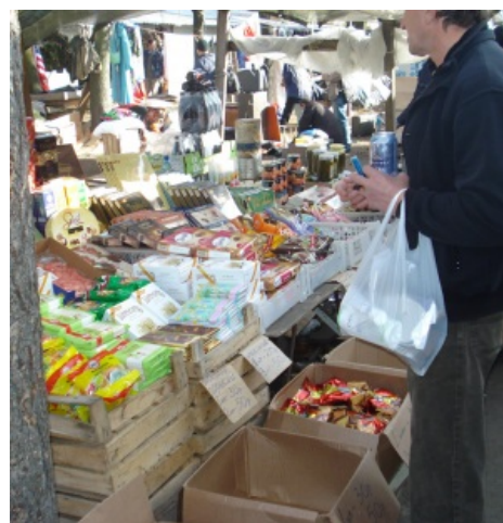
Шармэль! Просрочка на Уделке.