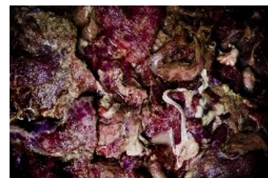
Вот так-то, амиго!

К счастью, прилавки с алкогольными напитками (единственным, за чем сюда может прийти человек, не относящийся к постоянному контингенту «Просрочки») расположены поблизости от входа. Штат работников магазина чуть более, чем полностью состоит из хачей , что как бы намекает нам — травят русский народ . Но существует и вероятность, что хачи эти — всего лишь нанятые за гроши гастарбайтеры , а хозяин — русский , либо же ЕРЖ .