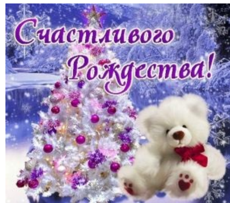
Пример блевотной открытки.