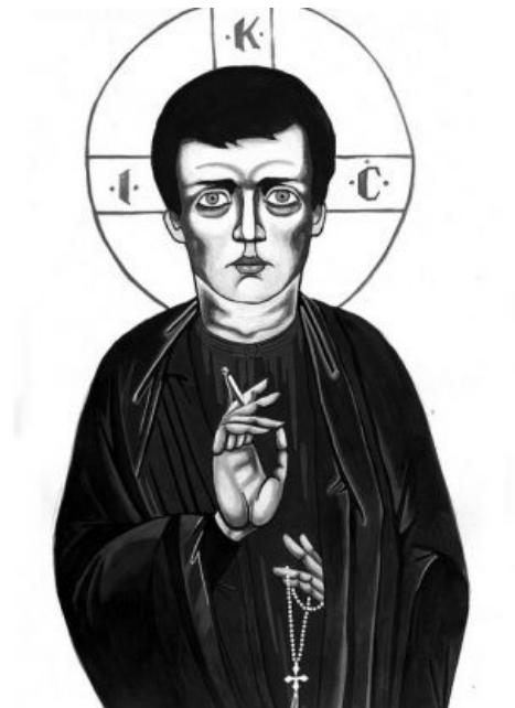
Б-г постпанка (пост-панк это православно, ага!)