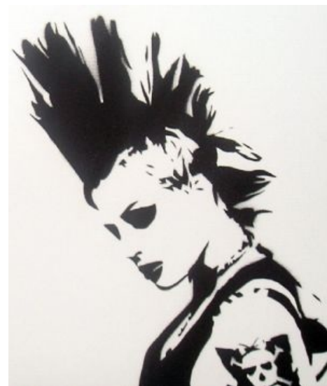
Самка пост-панка. Очень даже мило.

«Приятно удивила публика — говнарей почти не осталось. Было много народу в футболках Joy Division, Bauhaus и т.д., были симпатичные и хорошо одетые девушки, были даже хипстеры. »