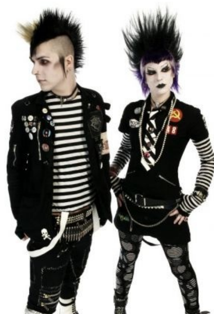
Типичные представители: уже не панки, но ещё не готы

Siouxsie and the Banshees - Christine Канонічно