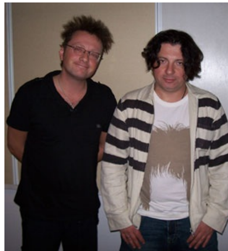
А твоя мама их ещё в молодости слушала!