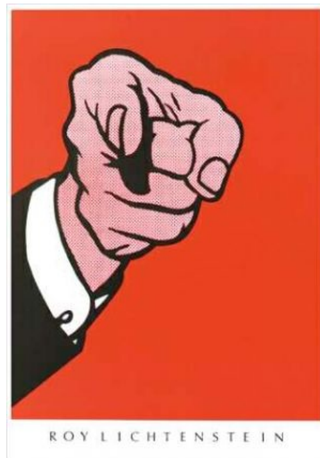
Рука Лихтенштейна указывает тебе твое место

«Поп-арт фактически индустриальная живопись, это то, чем скоро станет целый мир. »