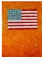
Джеспер Джонс. Он любил свою страну Америку