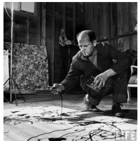
Так рисовал абстрактный экспрессионизм Поллок

Другие художники тоже хотели много-много денег и известности, некоторым просто хотелось постегаться над элитарностью да и над потреблядством вообще. Поп-арт начал с того, что брал любой популярный и знакомый всем символ, будь то фотки культуристов, ковбоев и пышносечных дев из глянцевого журналов, упаковки от чипсов или банки из под супа, и преподносил их как предмет искусства на здоровенных полотнах, но с откровенной иронией и сарказмом. Потом поп-арт можно уже было мастерить практически из чего угодно, вплоть до использованных пакетов из молока. Клаас Олденбург изготовлял из разных материалов всевозможную