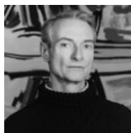
Собственно лицо Лихтенштейна