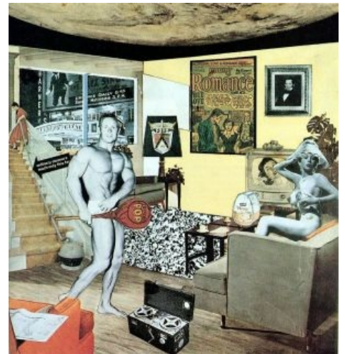
Гамильтон. Работа с очень длинным названием. Слепленные вместе вырезки из гламурных журнальчиков

«Нам нравится то искусство, где не видно искусства. »