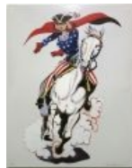
Mel Ramos. Miss Liberty — Frontier Hero