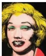
Потомки любят жабить поп-арт