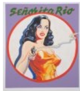
Mel Ramos. Сеньорита Рио