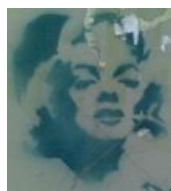
Граффитчики Питера любят поп-арт и Мерлин Монро