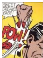
Еще один кулак работы Лихтенштейна