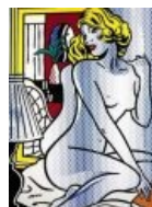
Ню от Лихтенштейна «Голубая обнаженная»