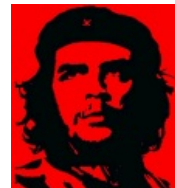
Каноничный поп-артовский Че Гевара