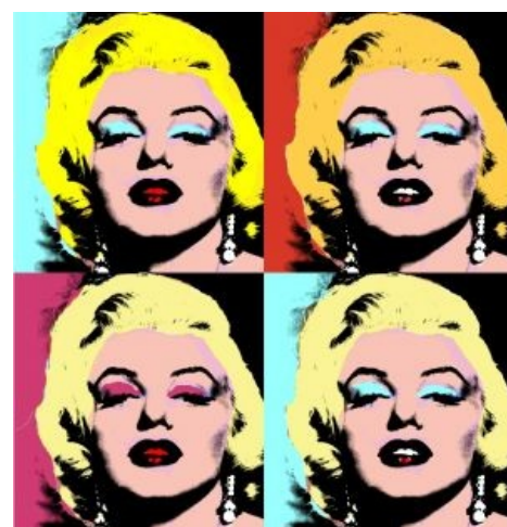
Та самая Мерилин Монро Уорхола