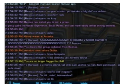
Фан — это святое.