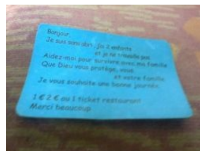
Та самая французская бумажка

В Караганды появился попрошайка в маске Гая Фокса Анонимный попрошайка из Казахстана.