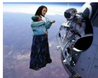
Сферическая в вакууме

Типичная цыганиха с дитятей, скорее всего упоротым гердосом