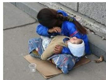
Типичная цыганиха с дитятей, скорее всего упоротым гердосом