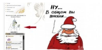
И такое бывает.