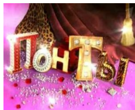
Кристаллические. В вакууме.

Если касаться собственно современных криминальных «понятий», то в настоящее время термин «понты» понимается в соответствующих кругах как