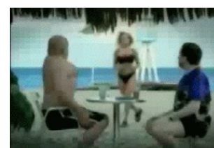
Понты перед тёлками — страшная сила!