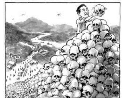
Сегодня мы будем строить пирамидку

Согласно общепринятому мнению, Пол Пот таким образом уничтожил около трёх миллионов человек. Ни много, ни мало — треть населения Камбоджи за 1300 дней. Другие исследователи , впрочем, полагают, что от организованных казней погибло около 100 тысяч человек, ещё два миллиона — жертвы голода, болезней и де факто войны с Таиландом и Вьетнамом, еще 600 тысяч — бомбардировки армии добра. Честно скажем: хрен разберёшь, давно это было, да и кто тогда проводил перепись в джунглях? Последний вопрос особенно приятен для травли истерящих либерастов, использующих миллиард съеденных лично