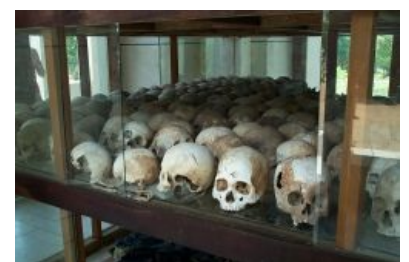
Миллиард расстрелянных лично Пол Потом