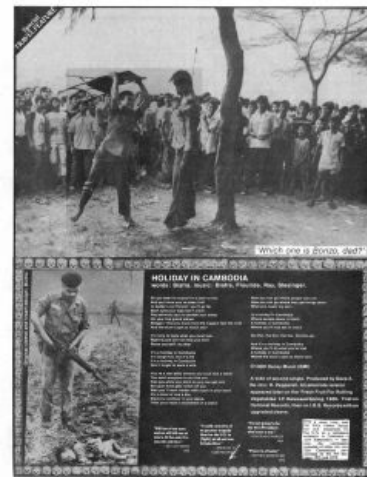
Это просто праздник какой-то! Буклет альбома Dead Kennedys

Русская Камбоджа Если же ты самурай — нож разрежет живот, Не воскресает Христос, так хотя бы воскрес Пол Пот. Что я могу —