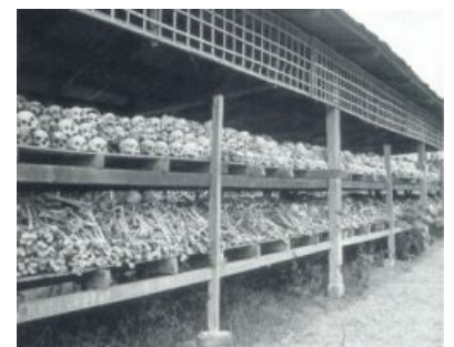
Демократия — это власть красных кхмеров плюс