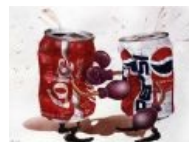
Пиздилка в разгаре.