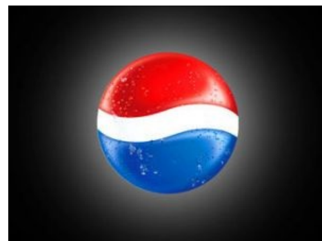
Старый логотип Пепси. Найди 10 отличий [1] .