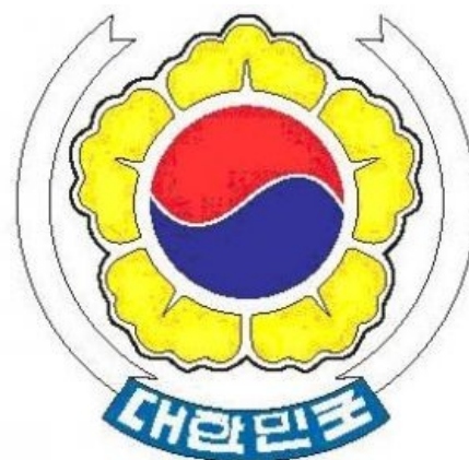
Герб Республики Корея