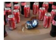
Или они нас.