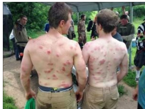
Да, тут тоже можно испытать баттхерт IRL