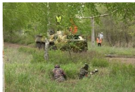
Зато шушпанцеры бывают не только из «Запорожцев»