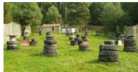
Сферическое место действия

как зачастую эти маркеры тяжелы, страшны на вид и громоздки), гранаты (урон по площадям, обычно в радиусе полтора-два метра, правда, в случае, если краска не вылетит одной огромной соплёй из единственной дырки, которая образовалась в резиновом корпусе неравномерной толщины, а то и вообще не сработает. 60-100% шанс оглушить или выкурить противника), дымовые шашки (+100 к скрытности на время действия), мины (см. гранаты, только надежнее срабатывают) и прочее. С вероятностью 99% к быдло клубу будет прилагаться шашлычная беседка, дабы, постреляв полчаса, пожрать и бухнуть.