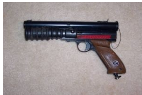
NelSpot 007 — прародитель этих ваших маркеров

Вся суть сводится к добыванию денег из тех, кто пришёл играть. Основная часть дохода — шары. Нетрудно посчитать, что стоимость шаров обычно завышена в два-четыре раза. Также можно за доплату взять различные нужные вещи , такие как более длинный ствол (+5 к точности и +10 к дальности), маску с незапотевающей линзой (fog resist), которую обычно в прайсе называют VIP-маской , электронный маркер (+10 к скорострельности и точности — в умелых руках), почти антуражный маркер (+10 к длине пискки поцента и всё, так