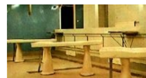
В ожидании клиентов