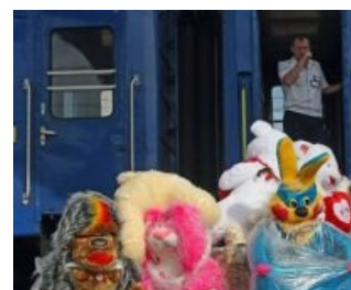
Дядь, ну купи зайца