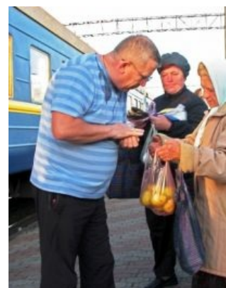
Сынок, грушки надо