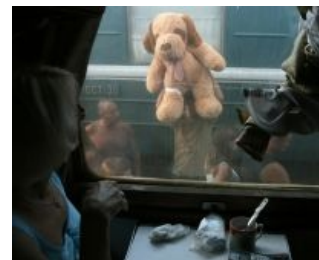
Плюшевый пес, он придет за тобой