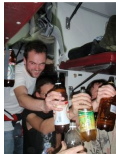
Железнодорожные фанаты в естественной среде обитания