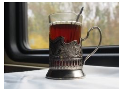
Неизменный атрибут каждой поездки

поезда. Ваша задача (если едете один) — отвоевать хотя бы законную четверть территории. А если стол уже оккупирован врагом, то постараться вытеснить его хавчик со своих законных земель. Если попутчики попались адекватные и компанейские, то стороны объединяются и уже не делят хрючево на «твое» и «мое». Во всех остальных случаях поединки за владение столом сопряжены с напряжением, нервоотрёпкой и убийственными взглядами. А если ваши попутчики едут с детьми — то бой можно сразу сливать, так как детское питание, упаковки от чипсов, бутылки со всевозможными газировками и прочее будут везде, включая вашу суверенную полку. Жрать придётся украдкой, с краешку и, возможно, даже на весу.