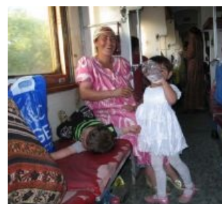
Тоже твои соседи