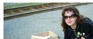
Сынок, грушки надо