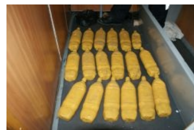
Нямка в дорожку, или богатый улов погранцов