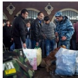
Приятное начало приятного пути

При проезде узбекской и туркменской границы (да, поезд идет почти через все государства Средней Азии) цирк с пограничниками повторяется. С поправкой на то, что узбеки еще более злобные и алчные, чем их русские коллеги. При проезде Узбекистана и Туркменистана запрещено выходить на станциях, причем при проезде территории Туркменистана запрещено даже ходить в туалет и курить в тамбуре, дабы сраные таджикские гяуры