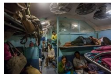
Общий вагон в Индии