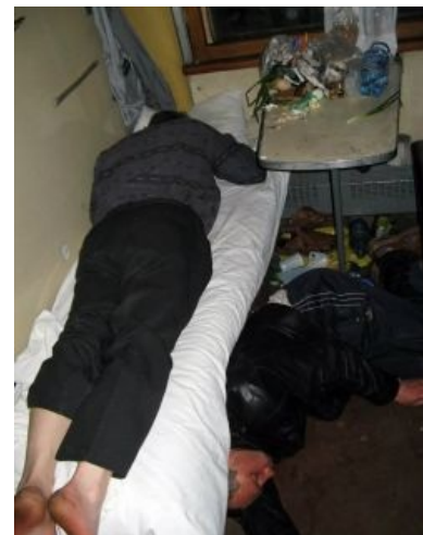
У нас здесь своя атмосфера

Михаил Задорнов "Хрусталь!!!" Задорнов в курсе