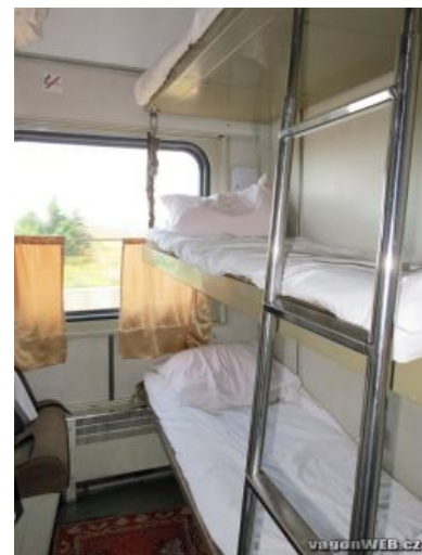
Всё для удобства пассажиров

Он же в народе «теплушка». Универсальный крытый товарный вагон, обыкновенно коричневый. Внутри у него приделаны полки (нары), а в холодное время года установлена железная печка типа «буржуйка» в количестве от одной до двух штук. Предусмотрена возможность деления теплушки на 3 отсека, но так делают редко. Освещён маленькими окошечками наверху: а ви таки думали, для чего они в товарняках? Туалет — распахивай дверь и ссы под откос. Нихера не подрессорен, поэтому трясёт в нём, как в ёбаной