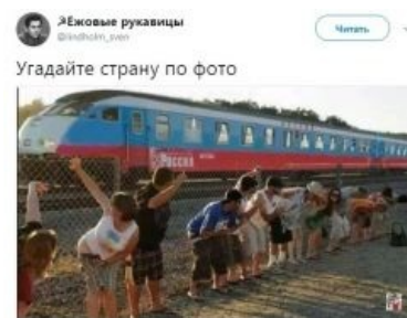
Гордый сосед демонстрирует европейские ценности...