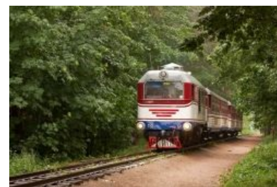
Типичный узкоколейный поезд