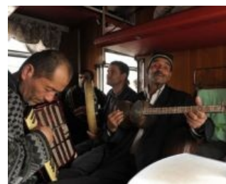
Твои соседи. Танцуют все