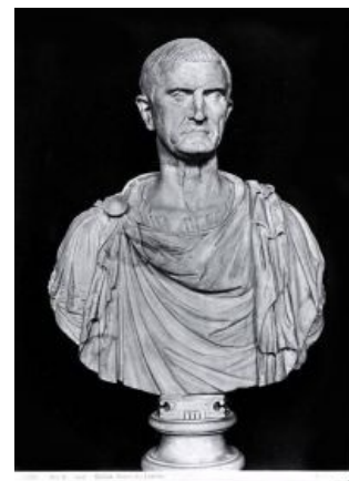
Красс собственной персоной

Оставив гарнизоны в покорённых городах, Красс свалил в Сирию. Мало того, что он не развил успех и позволил врагам подготовиться, так ещё и всю зиму занимался набиванием кошелька вместо поддержания боеспособности армии .