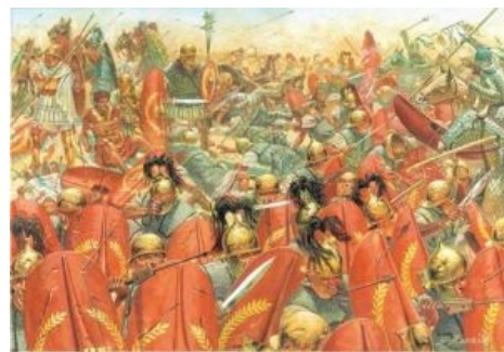
Битва при Каррах

...а катафрактарии — пронзить чресла римлян бурами копьями своими