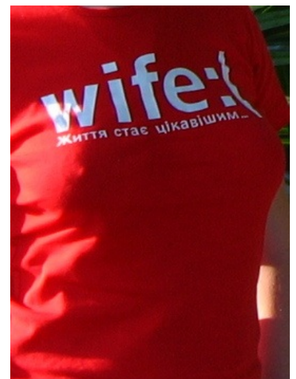
Лого life:) нашло отклик в народных промыслах.

Как бы то ни было, долгое время был нежно любим школотой и нищелюдами за бесплатную внутрисеть (не на всех тарифных планах!). Процвёл отчасти благодаря бесплатным раздачам номеров в учебных заведениях страны в 2005 г. Является автором одной из самых бесхитростных наёбок по имени «Привет с юга! Звони в Россию всего по 10 копеек!» (ниже мелким шрифтом: это стоимость только первой минуты. Вторая и далее по 50. Плата за соединение — 40. (сплусуй стоимость за первую минуту и соединение. Nuff said ). Не забываем умножить каждое число на 2