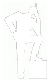
Логотип NWGSM (Мегафон до ребрендинга)

Последним хитом опсосовского маркетинга явилась массовая закупка iPhoneов 3 Же . Хитрожопая компания Эппл не продает их партиями меньше миллиона , потому каждый опсос всосал по миллиончику яблочофов. Увы, поскольку все поклонники этого аппарата давно протащили его через границу и разлочили, спрос на яблочфон оказался внезапно невысок.