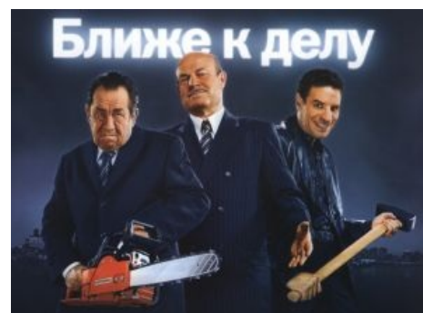
Ты еще не подключился к Теле2 ?? Тогда они идут к тебе

Обладает самым забавным роумингом через одно место: в стране пребывания симка мимикрирует и представляется эстонской Теле2: гешефт же! Российскому отделению Т2 не надо оформлять договоры роуминга, но самое главное — Эстония является членом ЕС, а значит — для оператора все входящие на территории самого ЕС будут бесплатны, а на межоператорскую маржу для принимающей роумера стороны будут наложены существенные ограничения . При