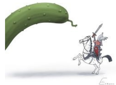
Онищенко и овощ

Решение о запрете ввоза вина и виноматериалов из Молдавии и Грузии, сообщается в письме Онищенко, принято после того, как проведенные в марте проверки показали, что большой объём ввозимой в РФ алкогольной продукции не отвечает санитарной безопасности.