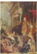
Игнатий Лойола изгоняет...