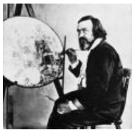
Глаза Дадда как бы говорят сами за себя.