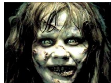
Ты узнаешь её из тысячи.

Самой известной лентой про изгнание бесов является «Изгоняющий дьявола» (англ. The Exorcist ) Уильяма Фридкина, который в свое время наделал шума и даже спровоцировал у на тот момент неискушенного западника приступы христого головного мозга. Сейчас никого таким кино не испугать, разве что провинциальную домохозяйку.