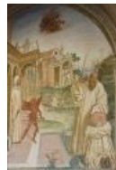
Святой Бенедикт изгоняет бесов.