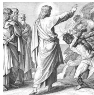
Платный курс по изгнанию бесов. Мастер-класс от Иисуса.