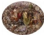
Одна из картин руки Дадда Осириса.