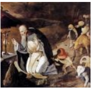
Антоний борется с бесами.