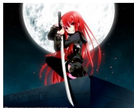
Кавайная лоли с катаной

Независимо от дальнейшего развития и общего качества сюжета аниме, в 93,635% случаев завязка будет выбрана из нижеследующих розовых мечтаний любого гика .