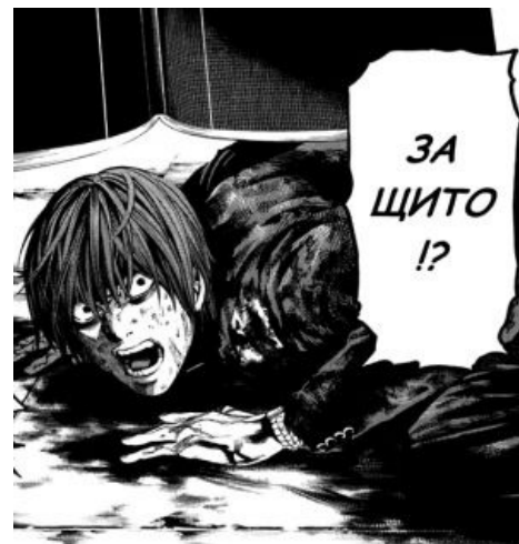
Обыкновенный японский школьник Ягами Лайт в не лучший день своей жизни.

Пример — Zero no Tsukaima , Shining Tears X Wind , KonoSuba , ReZero