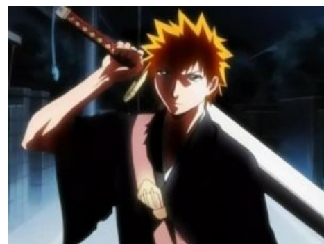
Обыкновенный японский школьник Ичиго Куросаки