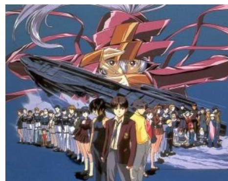
Обыкновенные японские школьники в космосе, тысячи их!