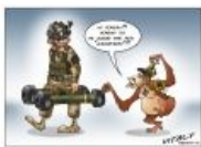
Укропитек с «дротиками». [1]