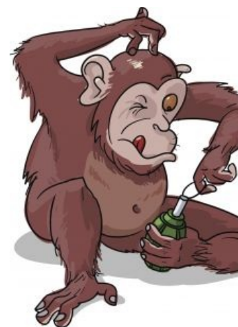
Вариант с «лимонкой»