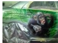
Принт, туда же.