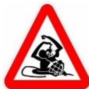
Наклейка на автомобиль.