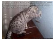
Кот с розеткой.