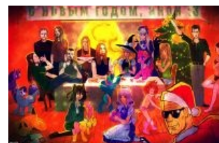
Новый год на Нульче

У этих странных созданий, живущих вниз головой, даже новый год отмечается в разгаре лета. В начале самого жаркого месяца эти человекообразные существа собираются огромными толпами на пляжах Копакабаны, отправляются на пикники к Большому Барьерному рифу и всякими прочими способами издеваются над заиндедевскими жителями правильного полушария. Когда тут зима и новый год, в той стране — лето и ...новый год.