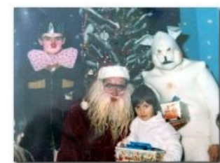
Веселого нового года!