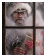
Новый год Рождество при Гитлере