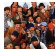
Типичное поздравление с НГ