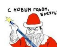
С новым годом, блеать