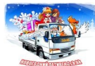
Новый год к нам мчится