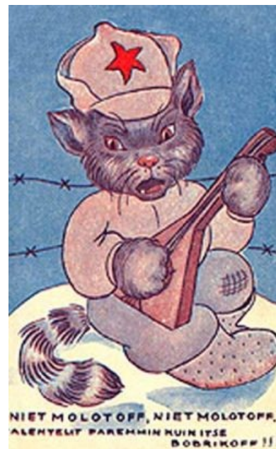
Котэ как бы поёт нам

Снова к тебе в гости едет русских гвардия, И Молотов сулит, что если двери распахнем, То всей страну счастливо и сыто заживем.