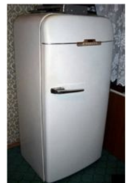
Один холодильник на 40 лет? Это нерыночно

Другой способ: сразу, путем разумного моделирования, найти наиболее подходящий способ и реализовывать только его, а чтобы подстраховаться от ошибок, можно законодательно запретить внешнюю экспансию на свой рынок. При таком способе ресурсы не выкидываются на ветер, и твёрдый профит от своего рынка обеспечен, но выход на внешние маловероятен.