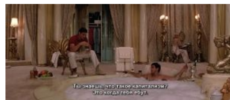
Тони Монтана о сути капитализма