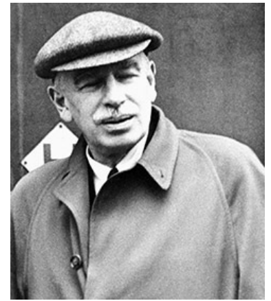
Кейнс: только госрегулирование спасёт экономику. И кепка

Но это сказка. А сначала присказка. Что представляла из себя Веймарская республика до прихода к власти НСДАП? Это термоядерный уровень насилия, коррупции, декадентства и нищеты, да и репарации за проигранную Первую Мировую, которые Германия платила союзникам, почему-то ни богатства, ни