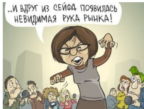
История про черную невидимую руку

Таки да. Человек, почитаемый либералами как воспеватель эгоизма, написал в том числе и упомянутый в цитате труд о морали. И в этом труде, между прочим, прямым текстом порицал слепое поклонение