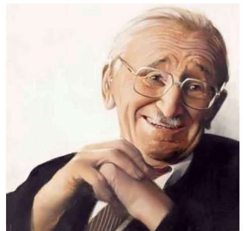
Хайек: Ну охуеть теперь