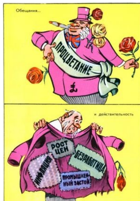
Как страшно жить

Далее, как выясняется, независимые бизнесмены-эгоисты не очень хорошо способны справляться с глобальными проблемами вроде войн, эпидемий, чрезмерно высокой или низкой рождаемости, паршивого образования, преступности, стихийных бедствий или плохой экологии. Эгоисты в таких случаях либо придерживаются принципа «моя хата с краю», либо вообще видят в массовых проблемах способ напилить ещё больше бабла.