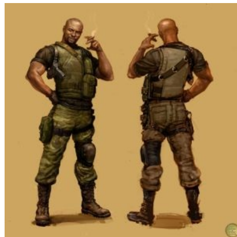
Сферический наёмник от игроделов. Mercenaries 2: World in Flames

В большинстве игр , в которых можно просто взять и убить , присутствует сабж . Тысячи их.