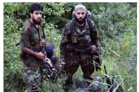
Арабские наёмники на фоне родных осин