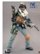
С чего всё началось. Та самая пластиковая фигурка