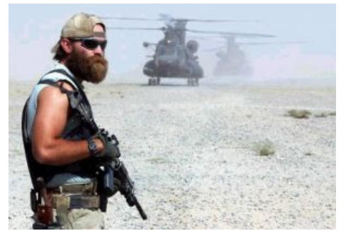
Суровый наёмник в Афганистане