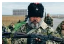
Кубанский казак Бабай на юго-востоке самизнаетечего. Могуч, суров, бородач