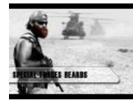
Борода специального назначения

А в разборках между ландскнехтами и швейцарцами, носившими бакенбарды, борода позволяла с одного взгляда отличить одних от других.