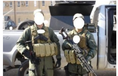
Операторы ЧВК в Афганистане