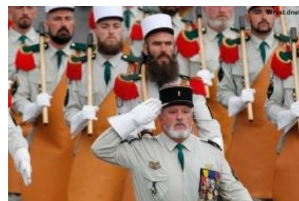
Форма и тактическая борода

Первые семь легионов были основаны ещё в 1523 году французским королём Франциском I, косплеившим римлян. К огорчению короля, легионы, набранные им, в основном, из глухих французских провинций, прославились лишь трусостью и мародёрством при полном отсутствии даже подобия дисциплины, и впоследствии были распущены. Повторно в 1558 году легионы основал Генрих II, но они быстро пошли в расход в войнах, которые он вёл. И наконец, третье основание: в 1831 году французскому королю Луи Филиппу пришла в голову отличная идея собрать по всей стране разнообразных нефранцузских нищелюбов и гопников и послать их завоевывать Алжир, кто выживет — тому французское гражданство и медальку; но большинство не выживет, а стало быть, во Франции будет легче жить, да и вряд ли потрепанный и уважаемый ветеран станет заниматься гоп-стопом на улицах. Фишку быстро просекли, во-первых, местные уголовники, а во-вторых — разнообразные европейские военные, по тем или иным причинам оказавшиеся не у дел. Делов-то, всего 5 (ну или 25 в дни основания) лет — и вы честный французский гражданин. А вербовщик даже имя не спрашивает.