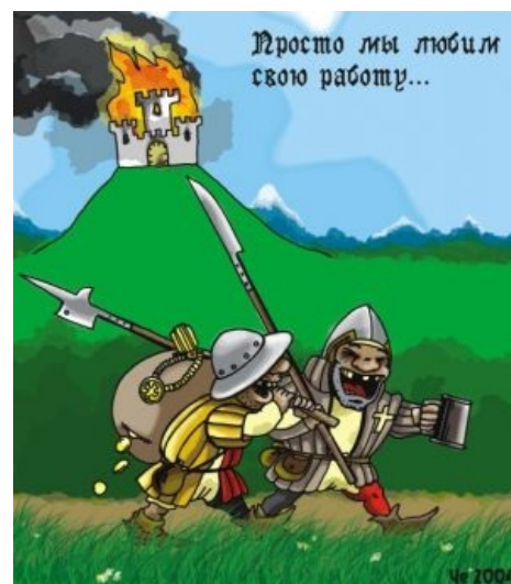
Просто они любили свою работу