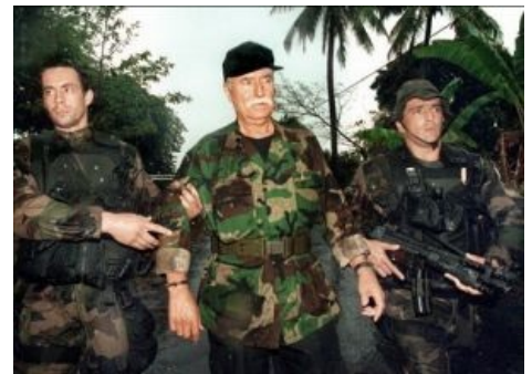
Бобби Денар под охраной

Символ современного наёмничества — Боб Денар (фр. Bob Denard ) — воевал в Конго, Родезии, Заире, Бенине, устроил переворот на Коморах с целью организовать свою собственную страну, этакий курорт для отставных наёмников, но не сложилось.