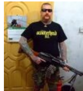
Бывший скин, а теперь медик в ЧВК в Афганистане. Он окажет тебе помощь, да