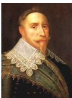
Густав Адольф смотрит на тебя,

Время наивысшего расцвета наёмничества. Многотысячные армии Мансфельда, Тилли, Валленштейна и прочих тридцать лет гуляли по всей центральной Европе, сократив население Германии примерно в три раза. Маскот эпохи — генералиссимус Валленштейн, лично содержавший стотысячную армию и вертевший на МПХ императора Священной Римской империи. Время рождения термина «мародёр» — от фамилии капитана наёмников Мероде, и слогана « Война кормит войну ».