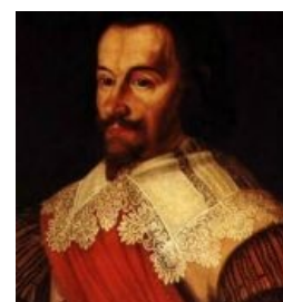
Валленштейн смотрит на тебя, как на Густава Адольфа

И как водится, пик успеха становится началом не конца, но медленного упадка наёмничества. Полупризывная армия Густава Адольфа таки дала тому самому Валленштейну соснуть тунцов при Лютцене, правда, сам Густав Адольф погиб, не успев насладиться победой. Такие дела.