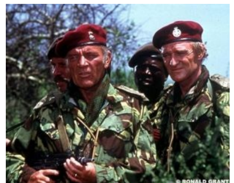
«Дикие Гуси» пафосны и брутальны

Адмирал Майлз Нейсмит Форкосиган возглавляет Флот Дендарийских наёмников (по сути, являющийся безотказным спецотрядом СБ Бараярской империи в винрарной « Сage o Форкосиганах » Лоис МакМастер Бюджуолд. Также известен наглухо упоротый эльф Джарлаксл — клан тёмных эльфов Бреган