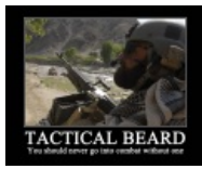
Без неё никуда

Наёмники клали болт на соблюдение уставной формы одежды и причёски и потому всюду отращивают бороду™. Кроме того, борода меньше выделяет своего носителя из основной массы местного населения в Муслимостанах. Казалось бы ничего такого, но какие-то корейцы запилили пластиковую коллекционную фигурку наёмника, в инструкции к которой среди прочего лута была перечислена «Тактическая борода». Естественно такой жыр не мог пройти мимо внимания 3,5 личностей, интересующихся ЧВК, свою роль сыграло и то, что борода придает особую брутальную няшность, ну и понеслось... В ныне покойном сообществе rmc-fan коллекция тактических бород насчитывала несколько сотен.