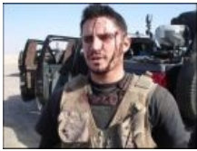
Издержки трудовых будней