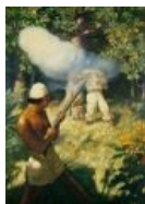
Разборки на Питкэрне между горячими парнями

Это секстант. Зная высоту Солнца над горизонтом в астрономический полдень и дату измерения, можно вычислить широту местности. Впрочем, зачем тебе это, продолжай дрочить на свой сраный GPS-навигатор