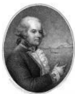
Уильям Блай в 1792 году, после мятежа