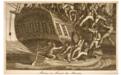
Ещё одна версия

«Положение наше кроме как отчаянным назвать было никак нельзя. Я знал, что на нескольких ближайших островах — если до них доберемся — население отнюдь не дружелюбное: они хорошо примут только тех, кто прибудет с подарками и с оружием более грозным, чем у них. У нас не было ни того, ни другого. Но главное заключалось в том, что наш баркас был очень мал, сильно перегружен и открыт всем ветрам и волнам, а пищи и воды хватало всего на несколько дней. И еще одно: более опытные моряки остались на корабле. »