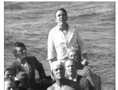
Уильям Блай в роли Чарльза Лоутона обещает суровые анальные кары мятежникам

Блай, оставшись в маленьком баркасе посреди Тихого океана, не стал падать духом. Он решил как можно скорее передать информацию о бунте британским военным кораблям, чтобы оперативно найти и анально покарать мятежников. Ближайшей европейской колонией был остров Тимор [3] . Сначала Блай с частью команды высадился на острове Тофуа, в 30 милях от которого и произошел мятеж. Но местные встретили англичан недружелюбно , один из спутников Блая погиб. После этого дружная компания, поджав хвосты, отправилась к Тимору уже без остановок.