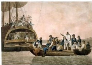
Мятеж, версия Роберта Додда

4 апреля 1789 года «Баунти», нагруженный over9000 саженцами хлебного дерева, отплыл от Таити. Ещё до отплытия недосчитались троих членов экипажа. Блай с помощью местных нашёл беглецов и выпорол их. Опять потянулись проклятые морские будни.