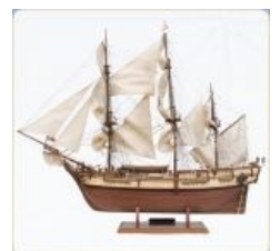
Модель корабля «Баунти»

Теперь осталось только набрать команду. В XVIII веке охотников добровольно служить в Королевском флоте было исчезающе мало. Капитан корабля был б-гом и анальным властелином не только команды, но и старших офицеров: его власть никем и ничем не ограничивалась. Что уж говорить о нижних чинах, которых за непокорность и в устрашение остальным могли просто вздёрнуть на рее без лишних разговоров. Весёлые наказания в виде порки тоже были обычным явлением. К тому же на таких небольших судах, как «Баунти», царил невероятная скученность, воды часто не хватало, экипаж страдал от цинги, уносившей многие жизни. Жёсткая дисциплина, самоуправство со стороны капитанов и офицеров, нечеловеческие условия жизни не раз провоцировали на кораблях кровавые столкновения. Поэтому в Англии процветал