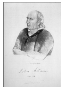
Джон Адамс, патриарх Питкэрна