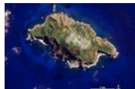
Остров Питкэрн, вид из космоса