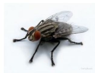
Муха в приближении

— Она перед посадкой на потолок переходит полу-бочкой в перевернутый полет, потом РШГ (ручка шаг-газ) до упора вниз, и бинго. Одна ей проблема - в перевернутом полете у нее очень маленькая устойчивость по каналам крена и тангажа, но я думаю у нее ЭДСУ хорошая стоит.