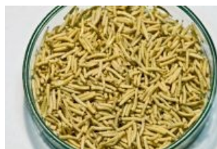
Доширак с высоким содержанием протеина

Да, читатель, мухи на самом деле очень важны. Природа позаботилась чтобы мух было не миллионы, а миллиарды миллиардов. Куда там человекам до таких цифр. Британские ученые в одной из своих просветительских передач заявляли, что одна парочка этих милых тварей способна породить за свою жизнь до 10 000 детишек. Муха — чудесный природный утилизатор гнилого трупья, опылитель некоторых няшных цветочков, хотя и не всех, поскольку многие цветы устроены таким образом, чтобы пчелиный ротовой пенис мог дотянуться до нектара, а мушиный не мог . Иногда муха пожирает личинок других насекомых. Чтобы понять, насколько няшными бывают цветочки, опыляемые мухами, можно понюхать пушисто-кожистый цветок африканской стапелии, или же занюхнуть похуже на усушенный МПХ соцветие азиатского растения аморфофаллуса. Некоторым нравится... Есть у мух одна любопытная особенность: они очень любят садиться на свисающие предметы. Поэтому у растения ариземы кроющийся лист вокруг соцветия отрастает в длинный «хвост», а липкую ленту подвешивают под потолком.