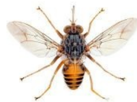
Муха цеце — чемпион по выпиливанию человеков в Африке

Вездесущие британские ученые и врачи решили использовать личинок некоторых видов мух в качестве средства лечения тяжелых гноящихся ран. Пригоршню хорошенько вымытых личинок просто привязывают к ране пациента, те начинают весело копошиться и поедать омертвевшие или гниющие ткани, доставляя носителю немало приятных ощущений. В итоге — чистая рана, не загрязнённая гноем: желудочный сок личинок имеет свойства антибиотика. А мушки спокойно окукливаются и вынимаются врачом. Win! Хотя этот способ лечения был известен довольно давно — со времён Крымской войны и Первой Мировой , но врачами не применялся, ввиду того, что просто не умели правильно мыть личинок (при попытках мыть их с мылом они неизменно дохли).