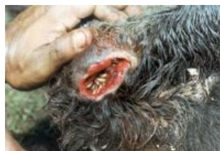
А вот и её малыши. Кушают коровёнку

Подробности мушиного epic fail в англоязычной Педивикии: тыц!