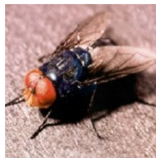
Вот она, красавица