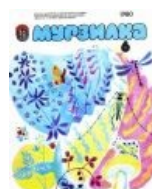
Остановим наркоманию среди детских художников!