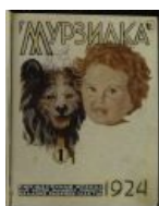
Первый выпуск, с инопланетным Мурзилкой