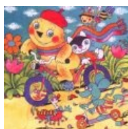
Каноничный Мурзилка, нотариально заверенный редакцией