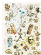
Кирпичная иллюстрация из рубрики про НЛО