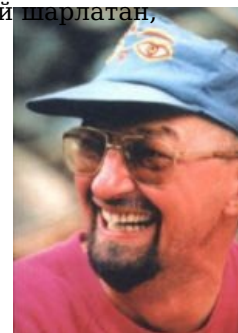
Я — руководитель экспедиции.

В медицинских кругах известен как директор Всероссийского центра глазной и пластической хирургии в Уфе, ДМН, имеет ряд оспоримых заслуг в своей области, что не мешает ему периодически съезжать с катушек и нести околесицу на малоизученные темы. Сабж находится в состоянии непрекращающейся перманентной шизофазии и является типичнейшим выпускником заведения им. Кащенко , что, впрочем, не помешало поциенту поднять бабло на своих «научных» трудах.