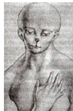
Такой лемуриец такой.

Интересно, что начав с, казалось бы, рациональных, логически выстроенных рассуждений, Мулдашев кончает выводами, полными атсрально-эзотерической хуиты . Выводы эти чуть более, чем полностью основаны на мракобесных сочинениях одного из пионеров шарлатанского движения Елены Блаватской, британско-канадского сантехника ирландского происхождения Сирилла Хенри Хоскинса, позже переквалифицировавшегося в пейсателя-фантаста и снискавшего скандальную славу под литературным псевдонимом Лобсанг Рампа (афftar шизотерического бестселлера «Третий глаз» и его продолжения), вылазках в Гималаи и прочие злачные на оккультные достопримечательности места, встречах с многочисленными гуру, ламами и прочими носителями восточной духовности (с которыми, как ни странно, он всегда находит общий язык). В довершение всего этот причудливый коктейль украшается прогнозами неизбежного всемирного пиздеца .