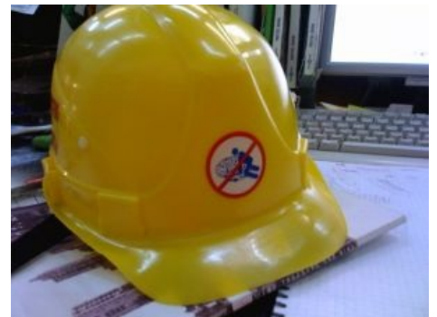
Прототип средства защиты от ебли моска. Пока не работает.