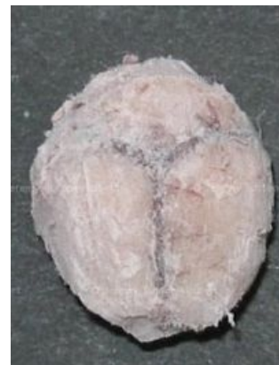
Мозги замороженные 1 штука

Небывалое ощущение, когда ты понимаешь, что в твоих руках самый емкий носитель информации, в нем все воспоминания, опыт и знания 86 летнего человека!