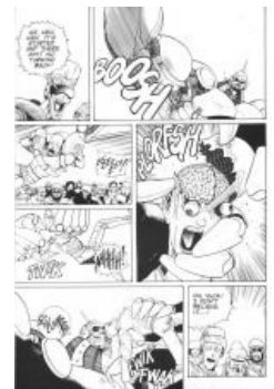
Поедание моска, ом ном ном.