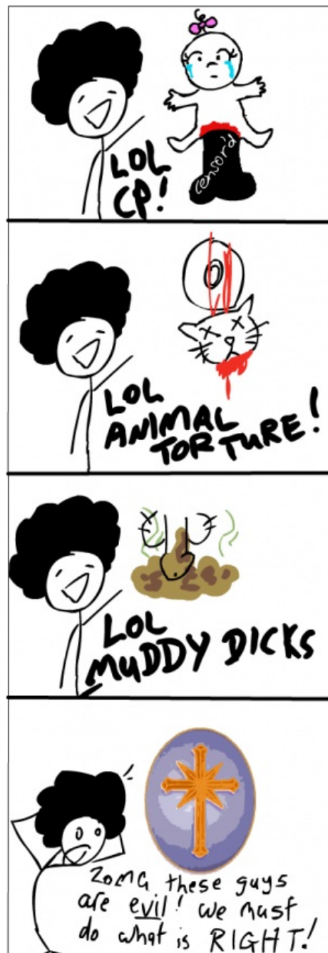
Троллинг аморального быдло-нюфага