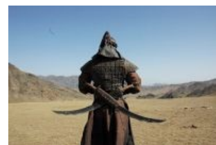
Брутальный монгол. Он даже не смотрит на

На самом же деле надо, сдуко, знать древнесредневековокитайский менталитет. Как уже упоминалось, китайское государство всю жизнь корчило из себя охуенно тоталитарное общество, где всё всегда по клеточкам . Оборонять такую махину у них бы всё равно не хватило никаких ресурсов, но вот психологическое превосходство Поднебесной над северными варварами Стена иллюстрировала отлично. Сам факт, что такую хуиту построили, уже у многих отбивал всякую охоту погостить нелегалами в Китае.