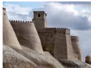
Старинная цитадель жемчужины Хорезмского оазиса, Хивы. Носит гордое имя Куня Арк. Монголы неплохо над ней поработали языком

Ходжент был довольно серьезной крепостью, находившейся в излучине Сырдарьи (это такая река, если что). А вот гарнизон в нём был разика этак в три меньше, нежели в Отраре. Однако это с лихвой компенсировалось комендантом — лучшим полководцем Хорезм-шаха Тимур-Меликом. Увы, этот достойный человек поддержал Джелаль-эд-Дина на военном совете и попал в опалу. Но казнить такого полезного человека было как-то ссыкотно, вот мудрый шах-батюшка и придумал ему почётную ссылку.