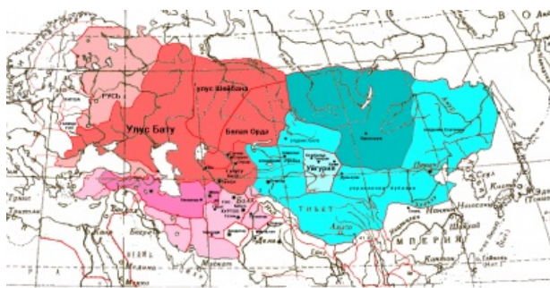
КАРТА 4. МОНГОЛЬСКАЯ ИМПЕРИЯ К КОНЦУ 1252 (ВНУТРЕННЕЕ ДЕЛЕНИЕ)

С тех пор о монгольском, в современном смысле, государстве как-то и говорить неприлично — на западе образовались независимые и враждующие друг с другом государства Джучидов, Хулагуидов и Чагатаидов, на востоке мы имеем отныне дело с Китайской империей Юань , одной из самых могущественных за всю историю Поднебесной. Кстати говоря, фаворитом приближённым хана был небезызвестный Марко Поло, оставивший подробное описание империи Юань и ряда других подконтрольных степнякам территорий. После визита — как водится в те времена, основательного, на несколько лет — хан даже просит купца привезти ему по-братски маслица с гробницы Христа в Иерусалиме и проповедников христианства на