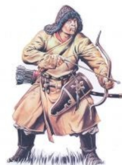
Злой монгол ползёт на берег , наточив

Монголы, придя уже огромным войском (около двухсот килосолдат, которых вели три сына Чингисхана, каждый из которых хотел взять Гургандж раньше своих братьев), начали долбиться об стены. Гарнизон и ополченцы их с удовольствием расстреливали со стен. Каждый штурм оборачивался кровавой баней. Проебав 50 тысяч на троих, братья сменили тактику и начали обстреливать Гургандж из китайских метательных орудий. Но тут выяснился главный лулз: камней-та не нашлось! Бомбардировки закончились уже на следующий день. (Позднее какой-то хитрожопый китаец придумал вырубать снаряды из дерева, и, вымачивая их в