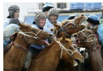
Монгольский доспех назывался «хуяг». Монголы зрели в корень.

По страшилкам школьных учебников истории, которые переключаются с реальной жизнью где-то серединка на половинку, средневековых кочевников и монголов в особенности принято изображать какими-то кровожадными монстрами. На самом же деле, бедная и вольная кочевая жизнь на открытых пространствах всегда формирует несколько иной менталитет. Это были вполне понятные люди со вполне внятной мотивацией — пожрать, поспать и размножиться, но надстройка тут получается несколько другая: во-первых, постоянная готовность обороняться и менять условия жизни (из-за открытых пространств); во-вторых, очень сильно развитая клановая взаимовыручка (из-за нищеводства и первого пункта); и только в-третьих идёт желание и умение грабить корованы, если предоставится случай. С другой стороны — мало у кого выдержат нервы мёрзнуть по ночам в степи, дни и ночи проводить с