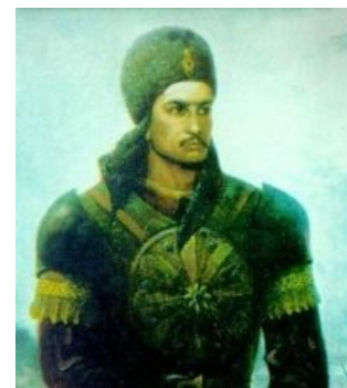
Джелаль-эд-Дин размышляет о будущем своей Родины