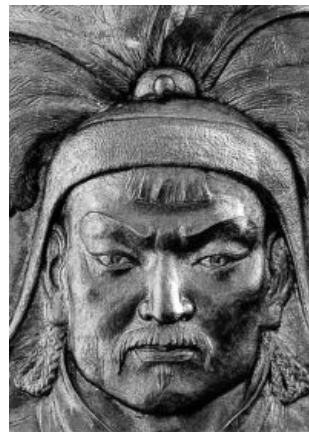
Чингисхан, фото на паспорт

А потом началась военная карьера. Найдя себе правильную крышу , Тэмуджин начал потихоньку закаляться в мелких стычках . Попутно враждебное племя меркитов захватило в плен его жену и, вероятно, обращалось с ней очень по-джентльменски , так что вся линия Джучидов — возможно, ни хуя и не Чингизиды. А ведь Джучиды — ханы Белой и Золотой Орд, наиболее интересные для истории Руси. Первая находилась за Уральским хребтом, а ханами её были потомки старшего сына Джучи — Ичана-Орды, считавшие себя выше золотоордынских ханов по роду. Они же, потомки младшего сына Джучи — Бату-хана, — правили в правобережной от Волги части улуса Джучи.