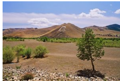
Монголы ждут возвращения Государя

средневековому государству, преемственностью с которым ымперцы и поцреоты как раз очень гордятся. Вот только гордиться там было уже в ту эпоху мало чем: бюрократия, коррупция и придворные интриги (не зря в английский вошло прилагательное "Byzantine" в значении "неадекватно сложный и забюрократизированный"), ультраконсерватизм, сакральность власти и сращение её с духовенством , а самое главное — гордость не объективными достижениями, а своим особым статусом и преемственностью от кесарей ... ничего случайно не напоминает?