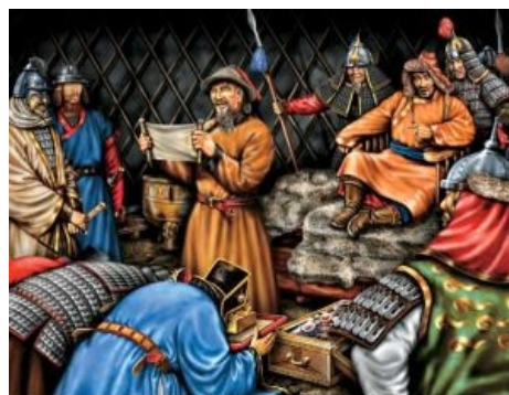
Монголы пишут письмо түреңкөмү еунтану китайскому императору

Сказывают — однажды на таком суарэ посол тангутского царя начал крутить шашни с Кулан-хатун (молодой женой Самого), хозяин смотрел-смотрел на это безобразие, да и спросил дипломатического шалопая: «Какого, спрашивается, твой царь обещал своих орлов пригнать мне на подмогу, а всё гуся морщит?!». Посланец же, забывший, где, собственно, обретается, возми и брякни: «Если у тебя мало