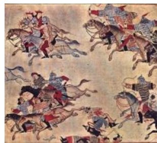
Runaway!!11. Иранская миниатюра XIV в.

По хитрому плану Хорезм-шаха, пока войска Хорезма в городах должны были сдерживать монголов, тот должен был собирать новое, огромное войско в Иране. Увы, не вышло. Собрав лишь двадцать тысяч солдат, он был настигнут войском монголов примерно в столько же юнитов. ИЧСХ , битва закончилась экстерминатусом для обеих сторон. Хорезм-шах наконец-то понял, что его сын был прав, вызвал Джелаль-эд-Дина к себе, быстро, решительно объявил его новым Хорезм-шахом и съехался на остров в Каспийском море, где и принял ислам (вторично).