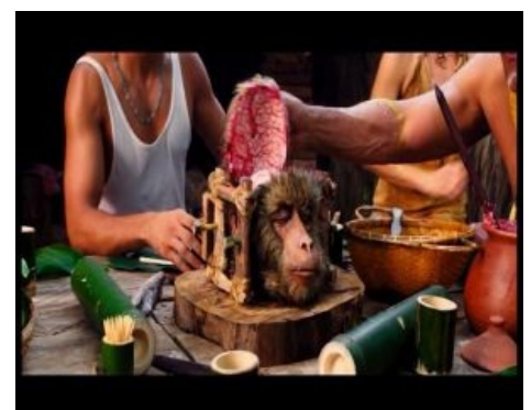
Из немецкого фильма «Турецкий для начинающих»