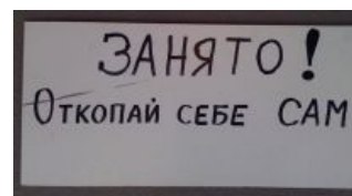
Еще один пример