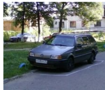
Место парковочное в вакууме

Стоимость и возраст машины абсолютно чётко коррелируют с частотой