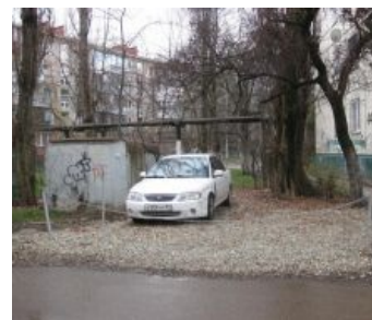
Бывает даже так