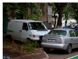
... и типичные последствия