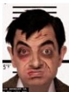
В полицейском участке