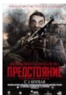
Великое кино о великой войне