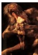
Бин живописный пожират трупы... Ой-вей