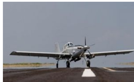
У пиндосов есть свой мирный бронированный Air Tractor

https://www.youtube.com/watch?v=7NvN5U5pLU Уже и в мультфильмах