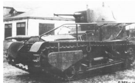
Мирный немецкий трактор. Истоки всех вышеперечисленных