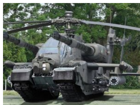
Ещё более мирный российский трактор