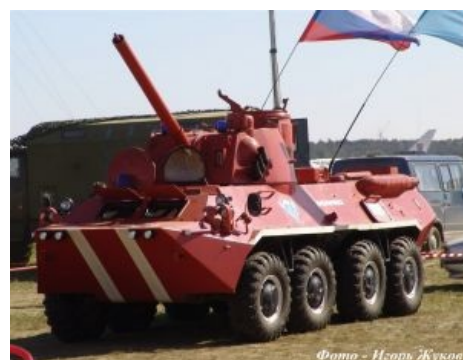
Мирный пожарный автомобиль Этой Страны