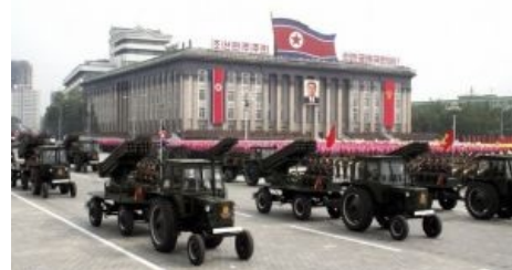
Корейские мирные тракторы — самые тракторные тракторы в мире!