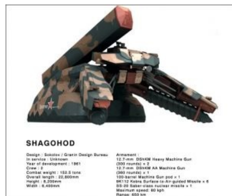
Мирный советский комбайн второго поколения. Два шнека, термоядерный элеватор, ствольный измельчитель.