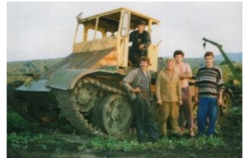
Мирный советский трактор на шасси Т-55. (спойлер: с ресурсом 500 моточасов)