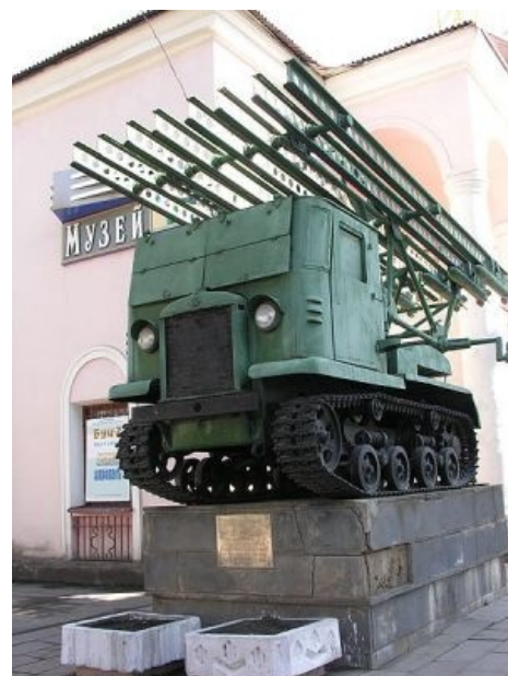
Мирный советский трактор из города Новомосковск. WW2 edition

Вчера утром советский мирный трактор с вертикальным взлетом занимался распахкой контрольно-следовой полосы близ китайской границы. Проходивший мимо китайский пограничный патруль произвел в районе дислокации советского трактора одиночный винтовочный выстрел вверх. Однако тракторист Петров по прозвищу «Старлей» не растерялся: подняв машину в воздух, ответил залпом, прополол танковую дивизию и сто пятьдесят гектаров пехоты противника, расположенные неподалеку в 500 километрах, после чего включил форсаж и вышел на околоземную орбиту. В связи с инцидентом ТАСС уполномочено заявить: при повторении подобных провокаций советское правительство направит в распоряжение председателя гвардейского