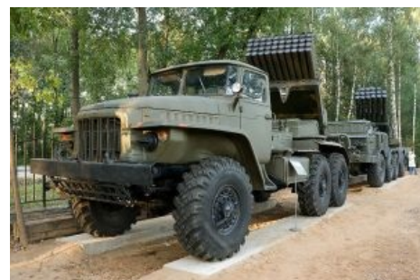
Мирный советский трактор с острова Даманский, РСЗО БМ21