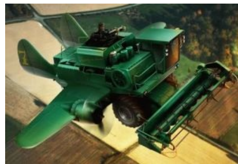
Мирный советский комбайн — старший брат мирного советского трактора

И «На испуг», и ХТЗ выглядели, как коробка для обуви на гусеницах, и представляли собой наспех обшитый бронёй трактор или тягач. Стрелять с него можно было, разве что высунувшись из люка с пистолетом , но для большей жути на лобовую часть приваривали водопроводную трубу, изображающую пушку. Правда, более продвинутые модели оснащали пулемётами, а около двух десятков тракторов получили 45-мм или 37-мм пушки от разбитых танков Т-26. Зато «НИ» имели другие поражающие факторы: тарактели, как целая дивизия, а для усиления эффекта на них ставили яркие фары и