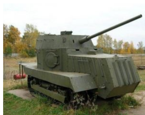
Бронетягач «ХТЗ-16»: стрелять не может, но забодает насмерть