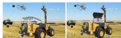
Мирный советский роботрактор в представлении художника НПО «Прогресс»