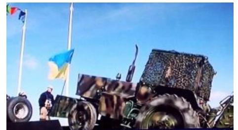
Мирный украинский трактор. АТО Edition