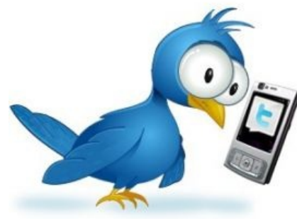
Как это выглядит

После массовой популяризации такого явления, как блог, появление различных ответвлений, в том числе и вида блога, в котором все записи были больше похожи на SMS-сообщения, стало лишь вопросом времени. Вопреки распространённому мнению, Twitter (о котором ниже) не был первым микроблогом. Вернее, он действительно был запущен первым, но на сегодняшний день известно о разработке сервиса «Nounser» от малоизвестной компании «Yahoo!», который должен был выйти раньше Twitter, но разработчики попросту не успели его сделать . Ну, а уж после появления Twitter всё завертелось, и на сегодняшний день в мире существуют сотни микроблогов.