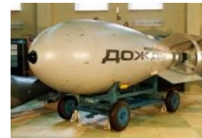
Русская ядерная бомба «Дождь»