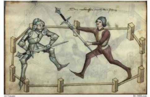
Когда хочется взять и уебать

В первую очередь стоит заметить, что наличие данного убердевайса в былые времена автоматически повышало ЧСВ владельца: определённую часть своей истории меч был не слишком бюджетен, а хороший меч и сейчас стоит дорого. Далее, в отличие от прочих ручных девайсов для экстерминатуса человека у меча есть ряд заметных преимуществ: