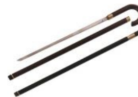
Для истинных дэнди

Со временем люди поняли, что мечом можно не только убивать друг друга на поле брани, но делать и другие интересные штуки. Например, забивать скотину. В индуизме сикхам ни в коем случае нельзя кушать мясо, которое