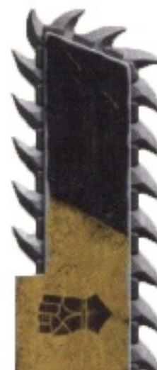
Sword-Like Object. Тысячи их