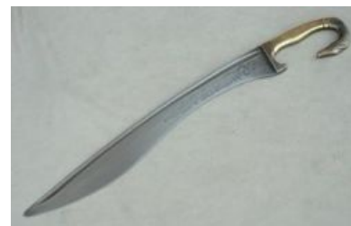
Фальката или махайра

Хотя о существовании железа человечество знало ещё с середины бронзового века, применять его в оружейном деле не спешили, ограничиваясь преимущественно ювелирной отраслью. Причина в том, что железо, в отличие от бронзы, требовало больших температур в кузнице, чего не так-то просто достичь, особенно без измерительных приборов. Кроме того, поначалу качество изделий из железа сильно варьировалось из-за наличия в нём разнообразных примесей, и, как правило, первые железные орудия сильно уступали в прочности бронзовым. Связано это было с тем, что ранние кузнецы по привычке пытались плавить железо, как бронзу, тем самым превращая его в мягкое говно. Дело в том, что из-за высокой температуры плавления железо трудно избавить от загрязнений — шлаков — нарушающих структурную целостность изделия и портящих механические свойства. Для борьбы с ними необходимо было использовать ковку, однако эта процедура требует не только силы, но и