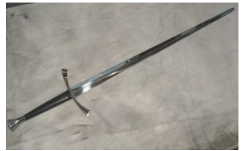
Полуторный меч, он же бастард.