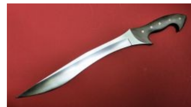
Копис. Найди 5 отличий от фалькаты/махайры

Между тем приблизительно к XII в. до н.э. выяснилось, что некоторые углеродистые сплавы железа, выделяющиеся серебристо-серым цветом на тёмном фоне крицы , обладают более высокой прочностью и упругостью, чем окружающее их сыродутное железо, загрязнённое кучей примесей и бедное углеродом. Однако при тогдашнем уровне развития металлургии получить сплав с нормированным содержанием углерода и примесей было практически невозможно, и результат очередной плавки даже очень опытный кузнец мог предсказать лишь крайне приблизительно. Только по окончании процесса можно было разобрать, какие сплавы получились — низкоуглеродистые, отличающиеся мягкостью и упругостью (и непригодные для закалки), или высокоуглеродистые, с плохой ковкостью (сравни с чугуном), но высокой прочностью и жёсткостью — если уж согнулись, то с концами. Поэтому использовались те же решения, что и ранее для бронзы: