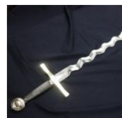
Меч для отжига.