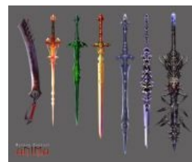
Sword-Like Object. Тысячи их