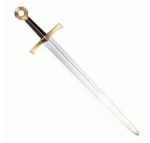
Из палаты мер и весов

В этой статье мы описываем само явление меча, а не составляем списки всех существовавших и выдуманных мечей. Ваше мнение о том, какие мечи достойны упоминания, здесь никому не интересно , поэтому все правки с упоминанием сотен вымышленных клинков из игорь и книг будут откачены, а их авторы — расстреляны на месте из реактивного говномета, for great justice!