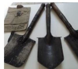
Малые пехотные лопатки

Младший брат и, по совместительству, убийца меча.