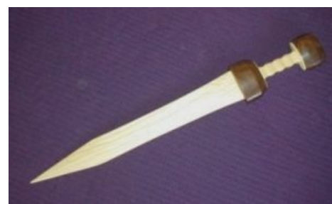
Каждый второй гладиатор мечтал о таком