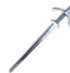
Айн, цвай, драй - выбирай.