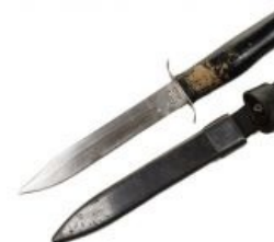
Младший брат и, по совместительству, убийца меча.