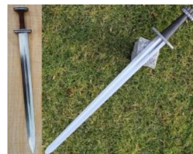
Вендельский (слева) и каролингский (справа) мечи

Сами мечи тоже претерпевают изменения. К VII веку в Китае или Великой степи возникают первые сабли, пока ещё мало отличающиеся от палашей. Однако уже к IX веку их конструкция приобретает современные черты, и они попадают в славянские земли и Византию, а через мадьяр — и в Центральную и Западную Европу, где, впрочем, не приживаются вплоть до XIV—XV вв.