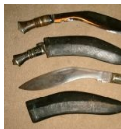
Кукри - расовый