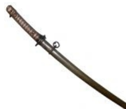
Гунто - расовый японский "нож" Второй Мировой.