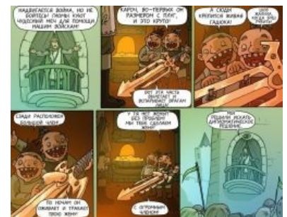
Доведение до абсурда