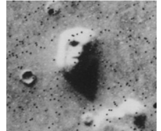
Голова на Марсе

Без этой программы статья была бы неполной