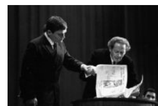
За это платили деньги