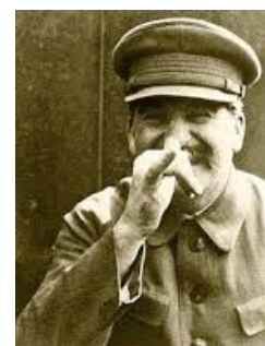
Наблюдает, как Мессинг рвёт усы Эйнштейну