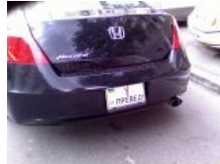
Номерной знак медведа, вид сзади.