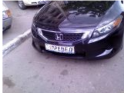
Номерной знак медведа, вид спереди.