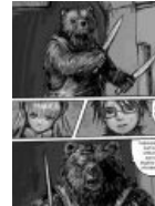
Цутому мощно укоренился в этой стране.