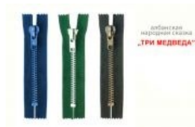
Олбанская народная сказка.