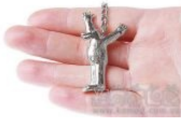
Медвед выходит за рамки киберпространства.