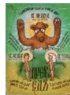
И сказал он Слово. И было это слово: «Превед!»