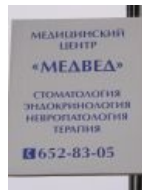
Медицинский центр «Медвед».