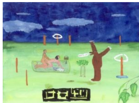
Оригинальная картина Джона Лурье