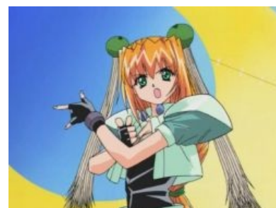
Я несу возмездие во имя Ильпалаццо-сама!

Рассматриваемый жанр давно и прочно укрепился среди себе подобных, а посему появление пародий на него было неминуемо. Делается всё это ради лулзов . Плюс к этому авторы могут высмеивать всю детскость и непосредственность, этому жанру присущую. Берётся героиня какого-нибудь левого аниме, из неё делают девочку-волшебницу [8] , чтобы посмотреть как гдунё она будет выглядеть в новом амплуа. Но зачастую зрителям нравятся подобные сюжетные ходы (пусть даже они никак на сам сюжет не влияют), потому что это даёт возможность расслабиться и просто посмеяться. Например, в одной из серий Clannad Томоя представил себе Кё в образе девочки-волшебницы, за что чуть не огрѐб от неё. В School Days есть бонусная серия Magical Heart Kokoro-chan , в которой рассказывается о жизни сестрички главгероини в бытность её девочкой волшебницей. А вот отдельный сериал Fate/Kaleid Liner Prisma Illya является спин-оффом Fate/Stay Night и буквально глумится над ним, да и над самим жанром тоже. И про наших любимых Трусьюку с Чулкой не забываем.