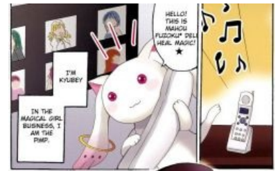
That I'm a motherfucking P. I. M. P.

понятия не имеет ни о махо-сёдзё, ни в чем же заключается эта самая деконструкция. Проще говоря, « Деконструкция — новый мем ньюфагов ». С одной стороны это позитивно отобразилось на жанре, потому что разные люди стали больше интересоваться им. Да и вообще эта вещь стала новой ступенью эволюции жанра, породив моду на махо-сёдзё с драматическим или просто довольно глубоким сюжетом. С другой же стороны это негативно повлияло на репутацию самого тайтла, но так всегда случается при подобных форсах. Также эту вещь иногда называют гаремом Кьюбея.