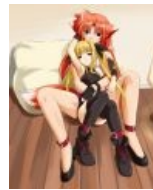
Фейт и Арф