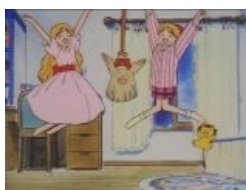
Эрика, Химеко и их маски