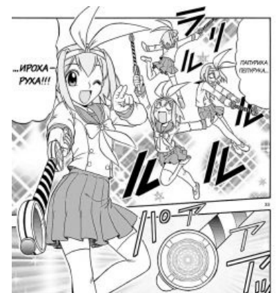
Простенький хенжин из манги