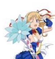
Вымышленная волшебница Канамин, популярна в Академграде