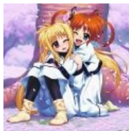
Фейт и Наноха