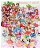
Много волшебниц — известных и не очень