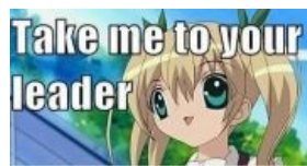
Маленькая низкобюджетная богиня Карин