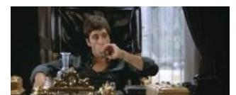
«Лицо со шрамом». Директор мафии в своём кабинете.