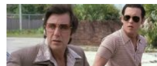
«Донни Браско». Он считал его своим другом...

Scarface School Play Лицо со шрамом. Школьный спектакль.