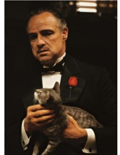
Вито Корлеоне и его сраная кошка

Но на деле самым крутым мафиозо в США на тот момент был Лаки Лучано. В начале