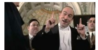
«Неприкасаемые». Звёздный час Де Ниро!

Второй, опять-таки, с Пачино. Классика американского (да и мирового, что уж там) кино, не в последнюю очередь из-за виртуозной актёрской игры исполнителя главной роли и великолепной музыки, написанной Джорджо Мородером. Снят Брайаном Де Пальмой, снявшем ещё и «Путь Карлито». Служил одним из двух основных источников вдохновения для авторов GTA: Vice