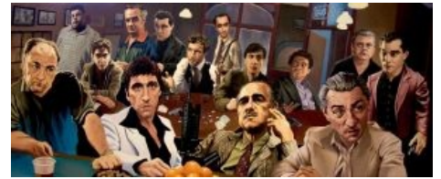
Кучка известных киношных мафигов