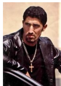
Типичный русский мафиози в голливудском фильме