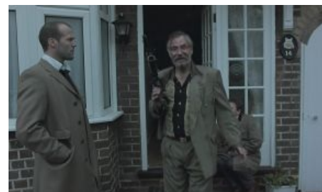
Борис Бритва: "Русские не сдаются"

На самом деле русский криминал за рубежом занимается либо откровенной хуитой по типу торговли палеными DVD или отжимом мобилок, либо серьезным бизнесом вроде отмывания денег , махинаций на финансовых рынках или торговли оружием. Поэтому реальные русские гангстеры за пределом этой страны обычно отличаются от среднего бизнесмена или финансиста только некоторыми особенностями своих занятий, в остальном же все как обычно — дорогой костюм по фигуре, хорошее образование и блестящий английский. Таким образом, русская мафия является эталонной клюквой , а пендосы... зачастую путают её с хохляцкими бандеровцами, а также с представителями кавказской породы.