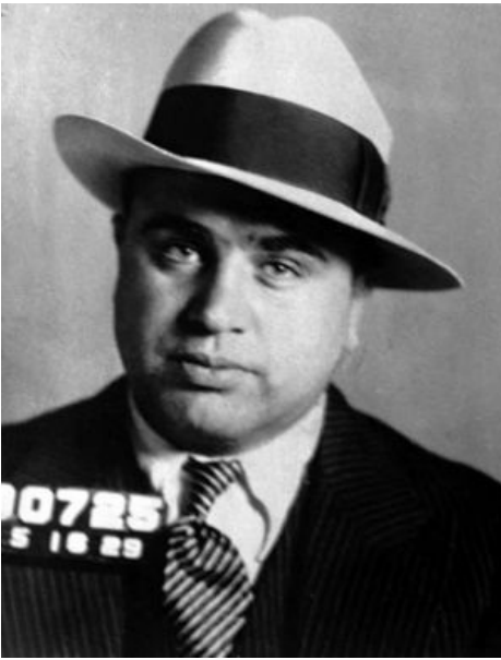
Ага, вот этот Аль Капоне!

своей карьеры он скромно занимался торговлей бухлом, азартными играми, шлюхами и прочим серьезным бизнесом, но вдруг, в начале 30-х, началась война между макаронниками Массерией и Маранцано. Стреляли они в друг друга стреляли, да в какой-то момент Массерия, благодаря Лучано, подавился мапой во время обеда. Маранцано организовал систему пяти сильнейших мафиозных семей Нью-Йорка, существующую и поныне, во главе с «Комиссией». Сам же он объявил себя «капо ди тутти капи», то есть главой «Комиссии» и паханом паханов итальянской мафии города. Но продолжалась это недолго — Маранцано, не без помощи