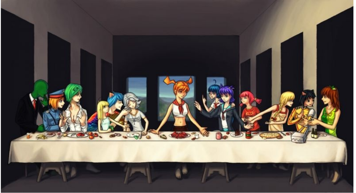
Маскоты всех основных русских анонимных имиджборд

фр. mascotte — амулет на удачу, талисман ) — первоначально название человека, животного или объекта, приносящего удачу — сейчас это практически любой персонаж, человекоподобный и не очень, представляющий некий коллектив: школу, спортивную команду, сообщество, воинскую единицу или бренд .