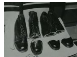
А на это Сливко усиленно фапал впрысядку