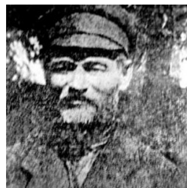
«Шаболовский душегуб» помолится за твою душу...

Полковник и Однополчане - Душегуб (Беда с сапогами)