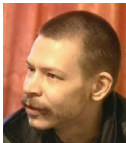
Спесивцев пытается не смотреть на тебя как на пельмени

https://www.youtube.com/v=G9ReLhmETA0 Как это было. Part 1 Криминальная Россия - Сибирский Потрошитель (2 часть) Part 2