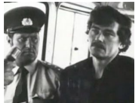
Совдеповский дядя Стёпа превращает Михасевича в говно своим взглядом