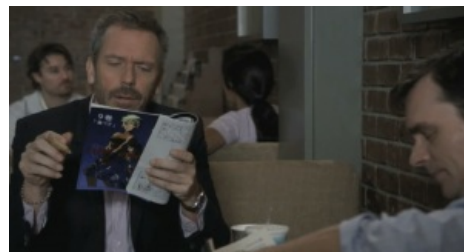
Америманга. Хаус одобряэ