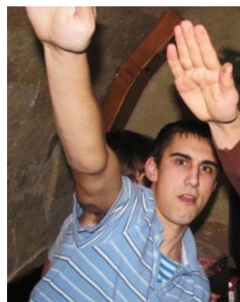
Максим приветствует ВАС!

Можно нарыть как минимум 6 разных версий происходящего от людей, которые при этом присутствовали, при этом места действия и кол-во участников у всех разные.