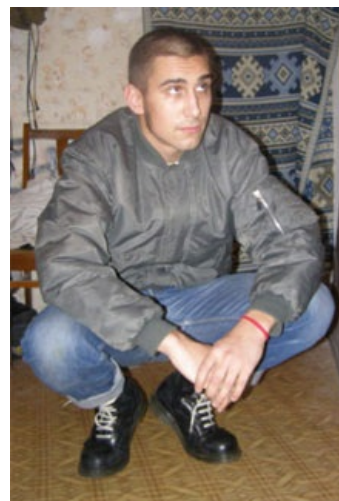
Добрый, патриотически настроенный студент

Про сабжа было написано немало высеров, которые на проверку оказывались чьими-то большими фантазиями или заказухой одесских левых. Хотя некоторые оказались правдой. На просторах сети были обнаружены несколько забавных фотографий одного из друзей Максима. В основном они посвящены