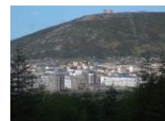
Вот такой он — Магадан

Во времена не столь отдалённые, да в принципе и сейчас, является устойчивым мемом. Известности немало поспособствовали сотни природных ништяков и горящие сезонные турпутевки в один конец, щедро распространяемые среди населения . Хотя за данными подробностями вам лучше отправиться туда .