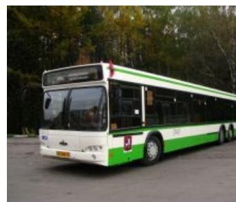
МАЗ 107 в естественной среде обитания