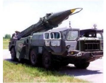
MAZ 543 со скудом