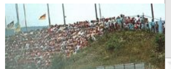
1991 год. Не показывайте змагагу — смерть от фапа обеспечена