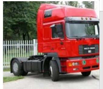
МАЗ-МАН образца 1997 года, с двигателем МАН, коробкой ZF, кабиной МАН и отечественным шасси