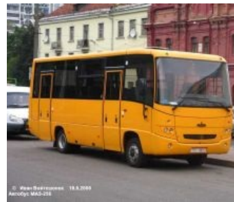
Тот самый Покемон

На выручку пришли кетайцы, которые стали дёшево продавать автобусики Yutong ZK8652HG. Но тут оказалось, что кроме «не-пазиковой» городской компоновки салона, для пассажиров они состоят из недостатков чуть менее чем полностью: ступеньки на входе, перепады высоты в салоне, странные горизонтальные поручни у окон, куча твёрдых держателей на лямках над входной дверью, норовящих дать по голове выходящим пассажирам, трогание-торможение рывками с характерным скрипом тормозов. А главное — накопительная площадка в автобусе отсутствует в принципе, на её месте почему-то расположились три оранжевых сиденья, так что коляску или дорожный чемодан поставить просто некуда. Хотя некоторые города и это проглотили на ура, ибо сие изделие оказалось на две головы выше любого пазика за счёт менее тесного салона с нормальной широкой дверью посередине и более низких ступенек на входе. Однако тут же выяснилось, что МАЗ-206 удельывает китаяца по всем статьям: он и длиннее, и сидений у него больше, и низкий пол на входе, и полноценный накопитель есть. Разве что ревет при езде как раненый бык и экологичную газовую версию имеет не очень, в отличие от Ютонга [4] . Вот только модель оказалась дороговата, так что результат оказался немного предсказуем - 3,5 богатеньких города