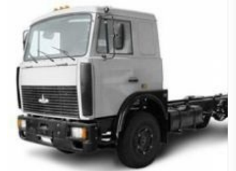
Сфеерический МАЗ 5440 в вакууме