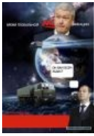
Время глобальной МЭРификации