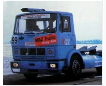
В зародыше. 1987 год