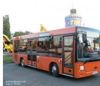
206 в Киеве