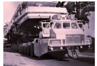
Та самая буксировка