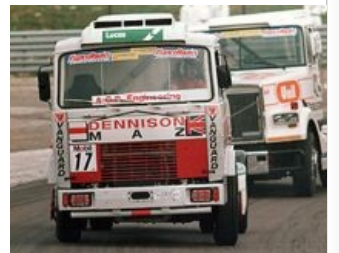
1991 год. Не показывайте змагагу — смерть от фапа обеспечена