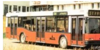
Длинный, красный, для девушек опасный (нет, МАЗ 101)