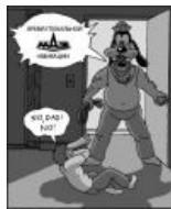
Типичное хобби после тяжелого рабочего дня под сабжем