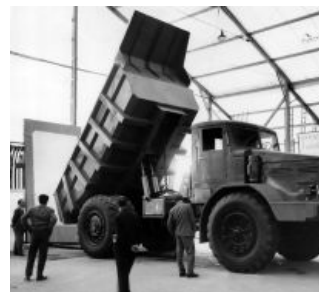
525 даже не смотрит на буржуазию

В 1959 году на базе 525 был создан аэродромный тягач МАЗ 541 (в количестве 3 штук), который по своему виду напоминал седан. В этом же году производство 525-х и 530-х было передано на БелАЗ .