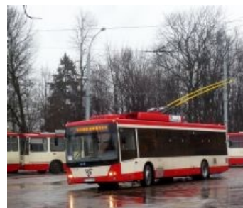
...и Amber Vilnis 12 АС. Найди 10 отличий