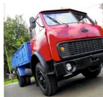
Головастик 5335 смотрит на тебя с пафосом

Пятисотый на пути к светлomu коммунистическому будущему