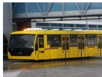
МАЗ 171 — если присмотреться, можно распознать гусеницу