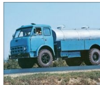
Пятисотый на пути к светлomu коммунистическому будущему