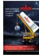
Плакат как бэ намекает что будет если купишь МАЗ