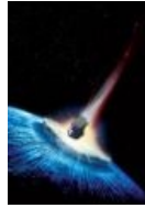
Новая версия апокалипсиса