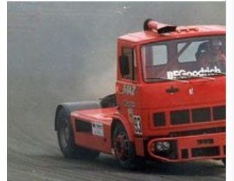
1989 год. MAZ на Нюрбурнгринге