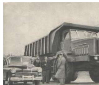
МАЗ 530 даже не смотрит на Победу