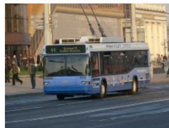
МАЗ 103Т в Минске

Маркетологи МАЗа, которые до этого никак не отличались от других белорусских маркетологов (сидя на постоянной неизменной жесточайше стабильной белорусской зарплате, которая фактически не зависит от эффективности твоего труда) они не выдавали ничего интересного. И вдруг ВНЕЗАПНО в 2011 году на сайте появилось 6 вполне себе годных плакатов со слоганом: «Время глобальной МАЗификации». В них различные вундервафли МАЗа были помещены на фоне космических пейзажей, бороздящими просторы вселенной, что как бэ намекает на уровень ЧСВ белорусского производителя. Оригиналы плакатов можно посмотреть здесь . Эти плакаты быстро разошлись по разным блогам и сайтам, где были тут же быстро и решительно отфотожаблены с применением годного и не очень юмора.