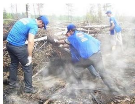
Имитация бурной деятельности воронежским отделением «ЕР» — фотографии два года, а дым появился сам, при обрезке в фотожопе