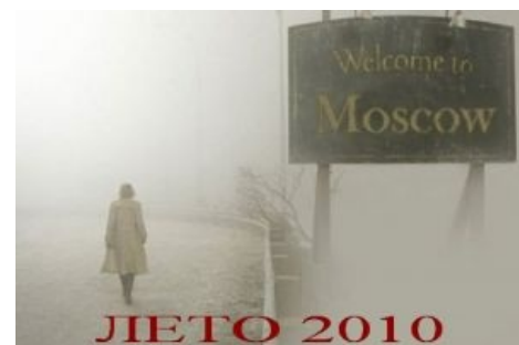
Лето 2010 в Сайлент-Хилле Москве