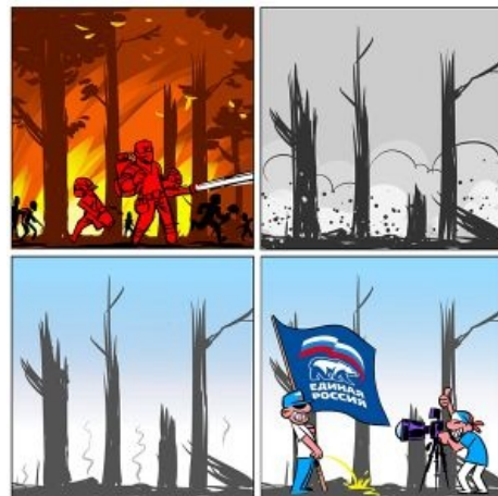
Активные действия неофициальных и официальных добровольцев

Не отстали от молодёжи и пенсионеры. Старик Батури́н, как исчез смог, сразу вернулся из отнюека спецоперации по спасению пчёл, но был спален из Кремля и получил предупреждение, позже ставшее одним из аргументов к выпиливанию с поста мэра Нерезиновой. Глава же лесного хозяйства Дефолт-сити и Ближнего Замкадя не успел вовремя вернуться, за что и был дисквалифицирован. Но наибольшее число лулзов можно было ловить во всяких официальных отчетах, рапортующих об окончании проблемы и народных гуляниях по этому поводу. Для интересующихся даже появился краткий сборник ярких цитат