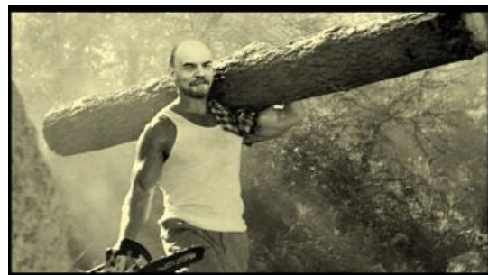
На самом деле

Дельфин - Ленин в кепке / Dolphin - Lenin in a Cap Дельфин популярно о Ленине, кепке и геволуции