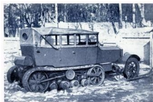
Полугусеничный Rolls-Royce Silver Ghost Ленина. А вы говорите бронивечок